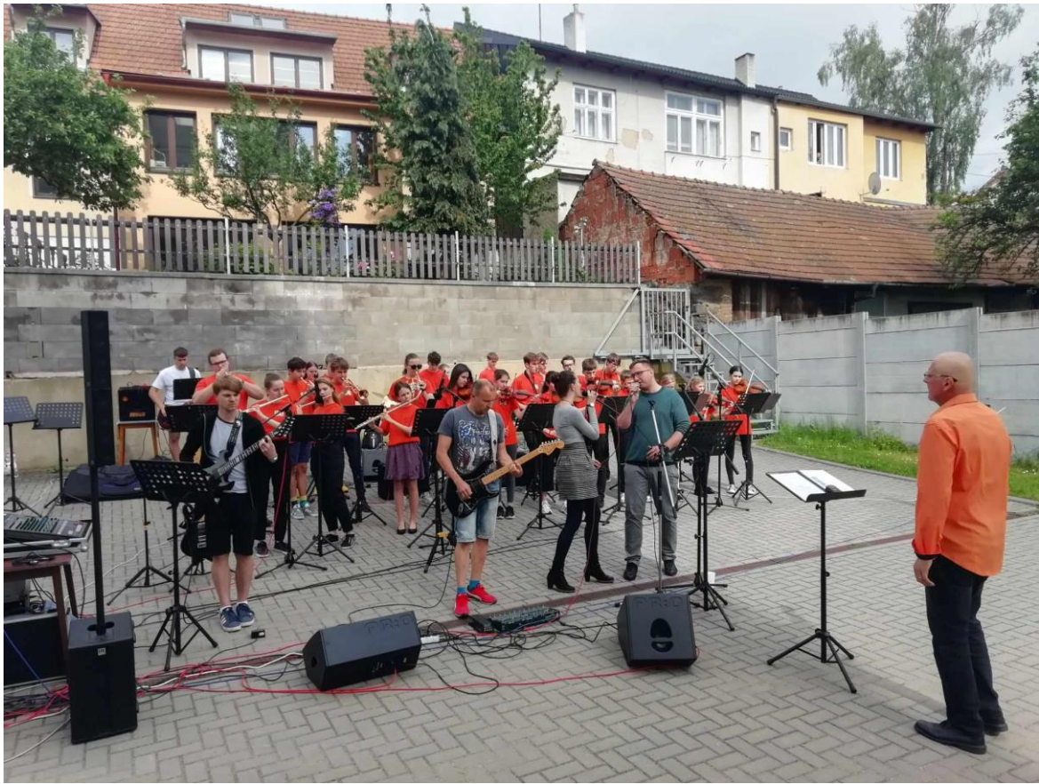
25.5. 2024 Muzikanti dětem